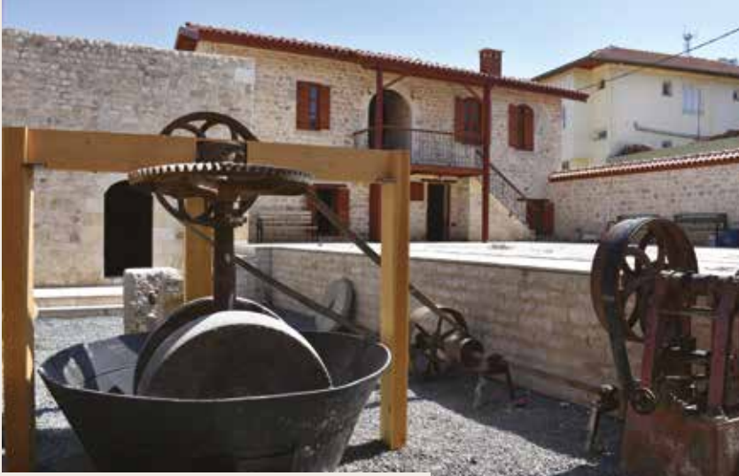
Tokatçı Mahallesi'ndeki zeytinyağı sıkma atölyesi, 10 aylık restorasyon çalışmalarlarıyla müzeye dönüştürüldü.