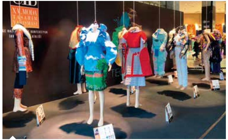
Akdeniz Tekstil ve Hammaddeleri İhracatçıları Birliği'nin (ATHİB) geleneksel Dokuma Kumaş Tasarım Yarışması'nda dereceye giren tasarımlar da (üstte) Design Week Türkiye etkinlikleri kapsamında sergilendi.

olarak, Türk tasarımlarının dünyada daha etkin pazarlanabilmesini sağlamak adına tasarımcı şirketleri ve tasarım ofislerini destekliyoruz. Hâlihazırda 14 tasarımcı şirketimiz ile 2 tasarım ofisimiz, yurt dışına yönelik gerçekleştirdikleri faaliyetlere ilişkin desteklerden faydalanmaktadır." diye konuştu.