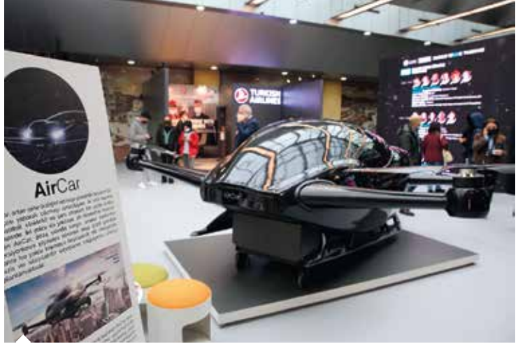
85 bini aşkın ziyaretçiyle rekor kıran 9. Türkiye Tasarım Haftası'nda endüstriyel tasarımlar büyük ilgi gördü.

Türkiye'nin en genç ve en inovatif ekosistemi İnovaTİM ailesi, İstanbul, Ankara, İzmir, Gaziantep, Isparta ve Erzurum başta olmak üzere 20 farklı şehirden bine yakın öğrenci ile Design Week Türkiye